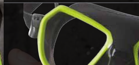
Telaio inserito per fusione Frame merged in its space