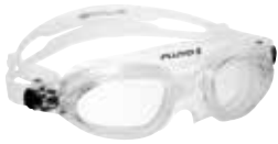
Trasparente/aqua | Clear/aqua