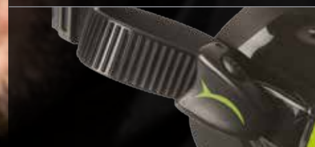
Fibbia regolabile con fissaggio micrometrico Micrometrically adjustable strap