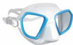
Bianco/blu | White/blue