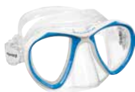
Trasparente/blu | Clear/blue