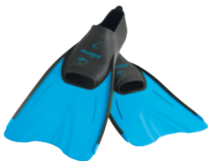
Blu | Blue